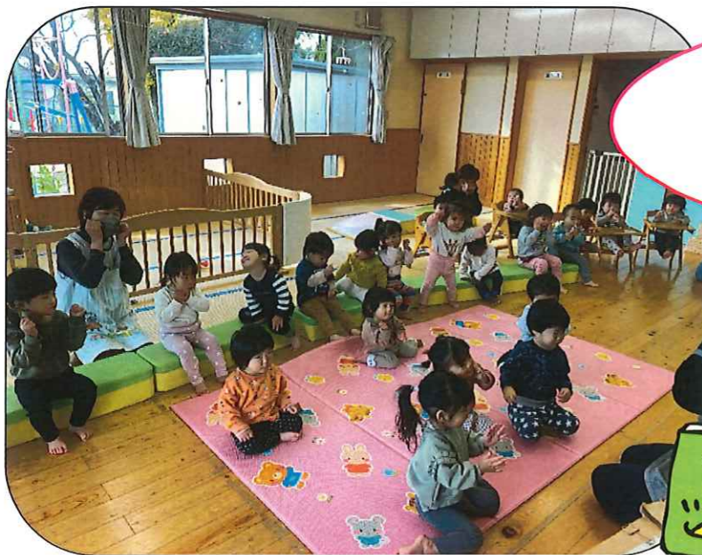
朝のおあつまりの 子ども達の様子♪