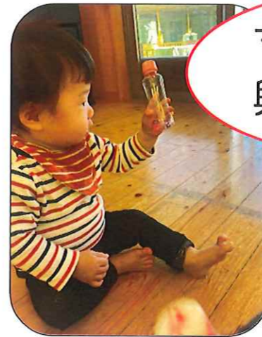
マラカスに興味津々♪